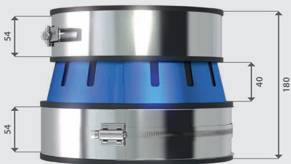
Alle Maße in (mm)